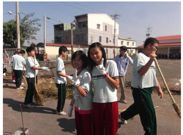
說明：一起努力，快樂多