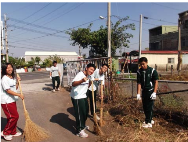
說明：一起努力，目標快達成了