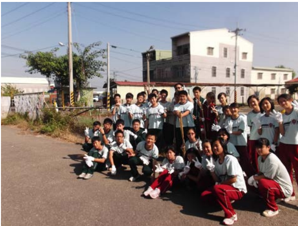
說明：準備就緒，要開工了