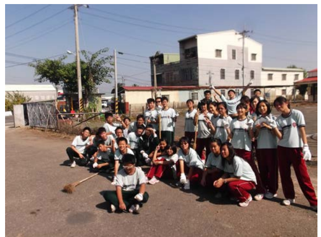
說明：完工了，環境變美了