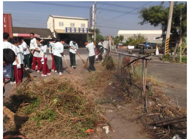
說明：開始清除雜草