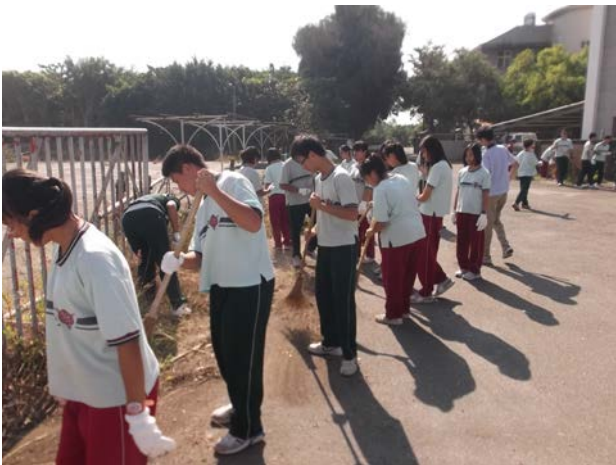
說明：同心協力，效率高