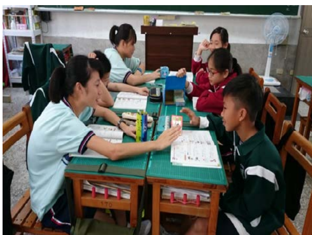
說明：小組作品分享與討論