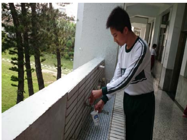
說明：先將容器清洗乾淨