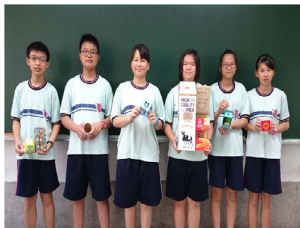
說明：優秀作品展示