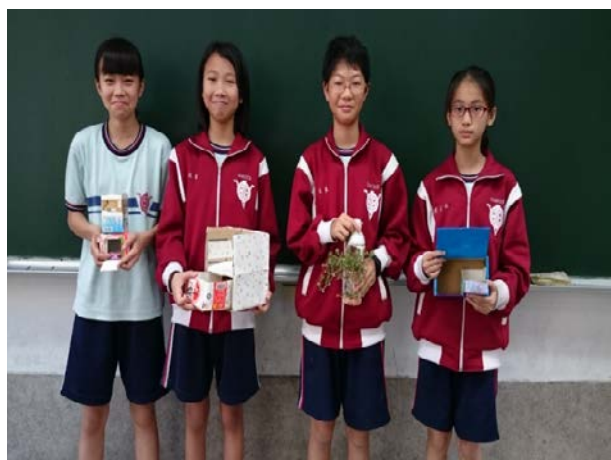
說明：優秀作品展示