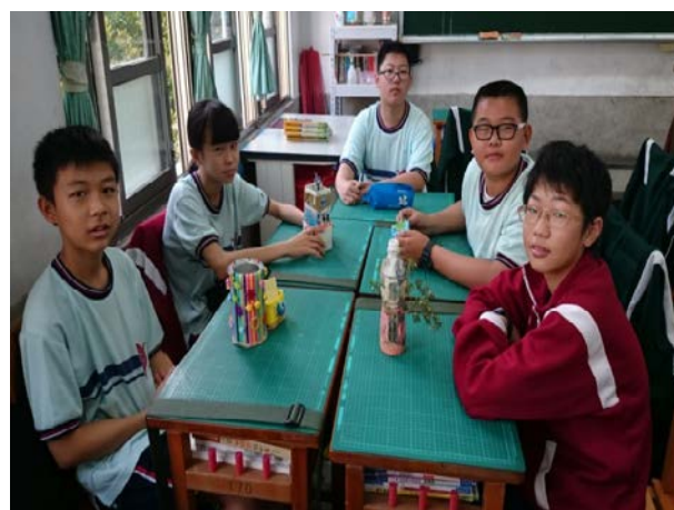
說明：小組作品分享與討論