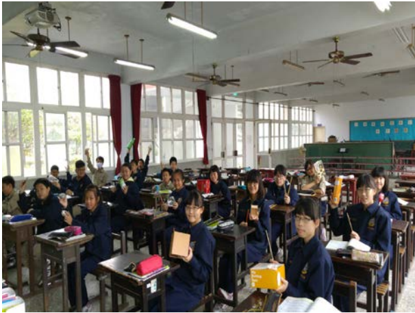
說明：同學帶來自己的自製擊樂器