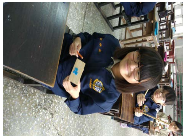
說明：同學自製「木頭類」擊樂器