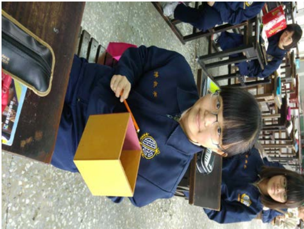
說明：同學自製「木頭類」擊樂器