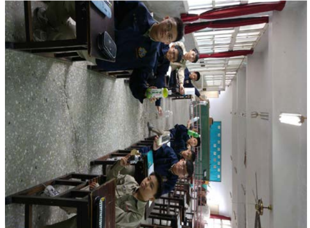
說明：同學自製「沙鈴類」擊樂器