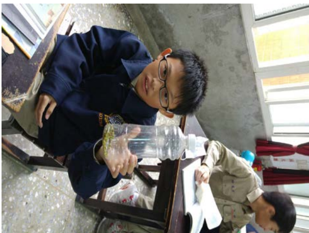
說明：同學自製「沙鈴類」擊樂器